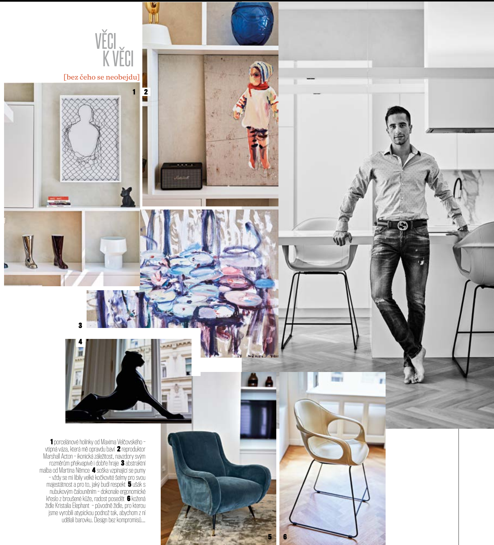
1 porcelánové holinky od Maxima Velčovského – vtipná váza, která mě opravdu baví 2 reproduktor Marshall Acton – ikonická záležitost, navzdory svým rozměrům překvapivě i dobře hraje 3 abstraktní malba od Martina Němce 4 soška vzpínající se pumy – vždy se mi líbily velké kočkovité Selmy pro svou majestátnost a pro to, jaký budiž respekt 5 ušák s nubukovým čalouněním – dokonale ergonomické křeslo z broušené kůže, radost posedět 6 kožená židle Kristalia Elephant – původně židle, pro kterou jsme vyrobili atypickou podnož tak, abychom z ní udělali barovku. Design bez kompromisů...